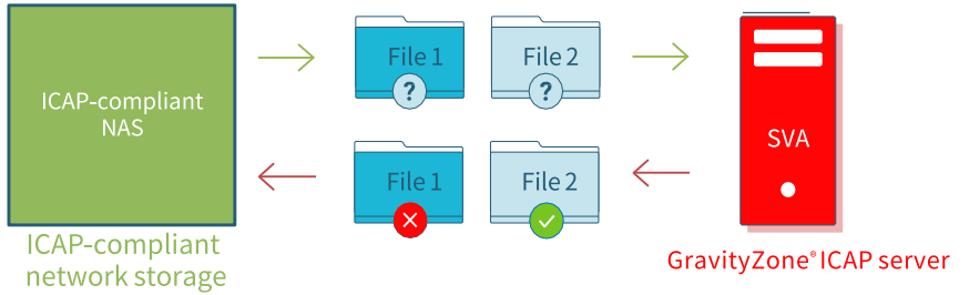
2 스토리지 시스템(ICAP 클라이언트)이 위협 요소 검사를 위해 파일 제출